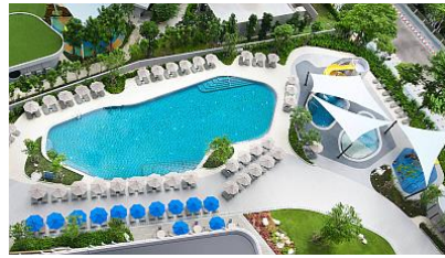
OZO North Pattaya