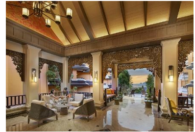
Amari Vogue Krabi