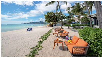
OZO Chaweng Samui