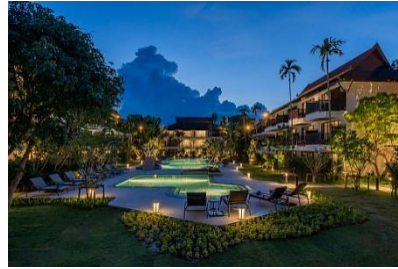
Amari Koh Samui