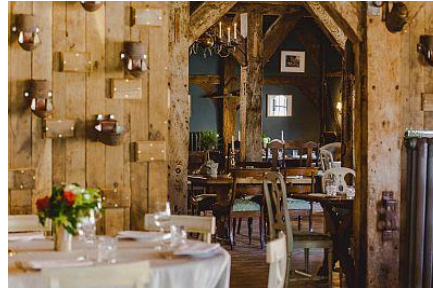
Arrangement zum Valentinstag im Kuhhaus Damp und Hotel Südspeicher