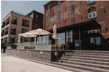
Hotel Südspeicher in Kappeln ©Foto: Südspeicher / Anika Raube Foto-Download per hinterlegtem Hyperlink oder hier