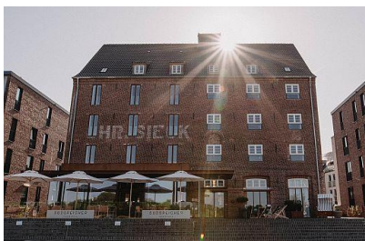
Hotel Südspeicher Außenterrasse