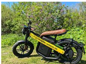
Per E-Moped in der Schleiregion Foto-Download per hinterlegtem Hyperlink oder hier